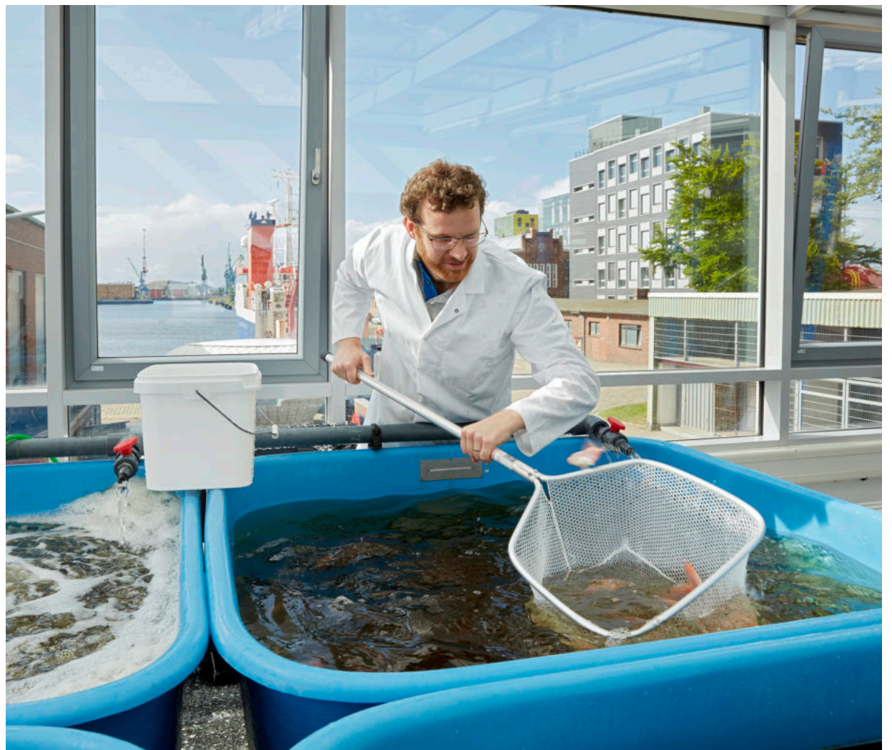
Beste Aussichten für eine erfolgreiche Aquakulturforschung bietet die Infrastruktur in Bremerhaven. Hier im Zentrum für Aquakulturforschung, aber auch an den Thünen-Instituten stehen moderne Anlagen zur Verfügung.

Genauso grundlegend ist die Standortfrage, vor allem für Aqua-