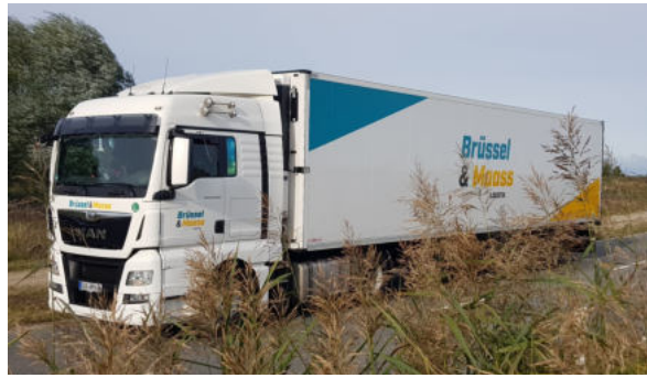
Die Umrüstung eines Bestands-Lkw und dessen Pilotbetrieb sind das nächste Ziel. Bislang sind noch keine Lkw der passenden Größe und technischen Ausstattung verfügbar, genauso wenig wie batterie- oder wasserstoffbetriebene Kühlaggregate.

Insbesondere zielte das Projekt darauf ab, umfassende Konzepte für die Abkehr von fossilen Treibstoffen sowie die Vermeidung von schädlichen Emissionen wie Treibhausgasen, Luftschadstoffen und Lärm zu entwickeln. Neben der Lkw-Zugmaschine lag das Augenmerk dabei auch auf dem Kühllaufleger, dessen Kühlaggregat unabhängig läuft – hier sind neue innovative Technologien auf der Basis von Wasserstoff und Brennstoffzellen gefragt. Neben den technischen Konzepten wurden Sicherheit, regulatorische Fragestellungen und Wirtschaftlichkeit solcher Wasserstoffanwendungen untersucht. Außerdem wurde durch Simulationen analysiert, inwieweit heutige Wasserstofftechnologien mit bestehenden logistischen Anforderungen in Einklang zu bringen sind.