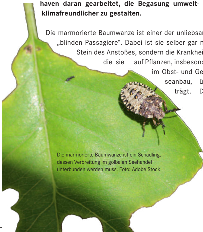
Die marmorierte Baumwanze ist ein Schädling, dessen Verbreitung im globalen Seehandel unterbunden werden muss.

Die marmorierte Baumwanze ist einer der unliebsamen „blinden Passagiere“. Dabei ist sie selber gar nicht Stein des Anstoßes, sondern die Krankheiten, die sie auf Pflanzen, insbesondere im Obst- und Gemüseanbau, überträgt. Denn