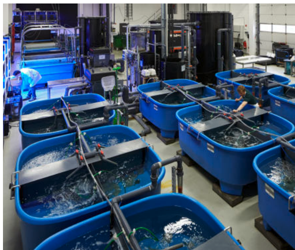
Eine Welt für sich: Im Zentrum für Aquakulturforschung laufen eine Reihe von sich geschlossenen Kreislaufsystemen.

Der Hauptgrund für den globalen Erfolg von Aquakulturen liegt in der wachsenden Nachfrage nach den gesunden Lebensmitteln aus dem Meer, die mit den stagnierenden Erträgen des „Wildfangs“ nicht gedeckt werden können. Im Jahr 2021 wurden in Deutschland rund 1,1 Millionen Tonnen Fisch und Meeresfrüchte (Fanggewicht) verzehrt, pro Kopf sind dies 12,7 Kilogramm. Doch der hiesige Appetit muss zum allergrößten Teil aus Importen gestillt werden. Die deutsche Eigenproduktion lag laut des Fisch-Informationszentrums 2021 bei nur rund 209.000 Tonnen (Fanggewicht), etwa 175.000 Tonnen waren Fänge der deutschen Seefischerei, 2.300 Tonnen der Binnenfischerei. Rund 32.700 Tonnen steuerten die deutschen Aquakulturen bei – das macht sie zu einem kleinen Erzeuger im internationalen Vergleich. Weltweit wurden 2020 rund 87,5 Millionen Tonnen aquatische Tiere und weitere 35,1 Millionen Tonnen Seetang und Algen in Aquakulturen produziert.