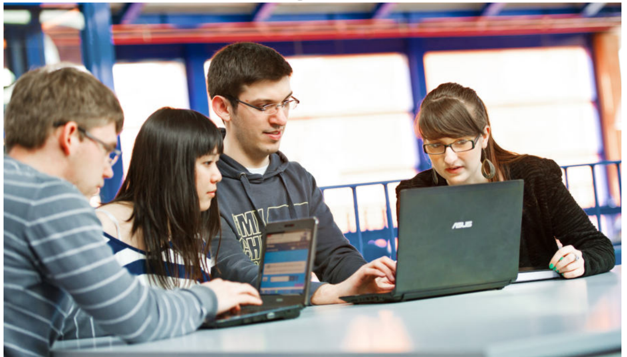
Die Studentinnen und Studenten der Hochschule Bremerhaven sind die Fachkräfte von morgen. Bedingt durch die Corona-Pandemie liegt die Zahl der Absolvent:innen aktuell nur bei knapp unter 400 pro Jahr. Aber alle Zeichen stehen auf Wachstum.