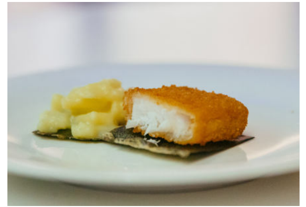
Der funktionale Prototyp, ein etwa 10 mal 10 Zentimeter großes Algenblatt, wurde in Bremerhaven schon von NORDSEE-Kunden auf Haptik, Geruch, Konsistenz, Aussehen und Geschmack getestet.

Die Anforderungen für die Marktreife sind hoch: Zusätzlich zu den bereits genannten Vorgaben muss die Verpackung auch den Alltagstest bestehen. Sie muss stabil sein, um die Handhabung im To-Go-Geschäft auszuhalten, und sie muss undurchlässig sein, sodass Flüssigkeiten wie beim frischen Fisch in der Verpackung bleiben. Auch um die wirtschaftliche Tragfähigkeit kümmern sich die Forscher:innen. Neben dem Basismaterial Makroalge sollen darum anteilig auch nachhaltiges Gemüse aus der angrenzenden Agrar- und Ernährungsindustrie verwendet werden. An der Verpackungsoptimierung arbeiten seit November 2020 das Forschungscluster Life Sciences der Hochschule Bremerhaven, die NORDSEE GmbH, die Firma Pulp Tec GmbH & Co. KG, ein Produzent für Fasergussprodukte, sowie der Nahrungsmittelhersteller Hengstenberg. Eine weitere Säule des Projekts ist die großflächige und kontrollierte Produktion hochwertiger Makroalgen unter industriellen Pilotgegebenheiten. Die Makroalgenkultivierung übernimmt dabei das Alfred-Wegener-Institut Helmholtz-Zentrum für Polar- und Meeresforschung zusammen mit der RO-V-AL GbR, die in Rockstedt bei Zeven bereits eine Algenfarm betreibt.