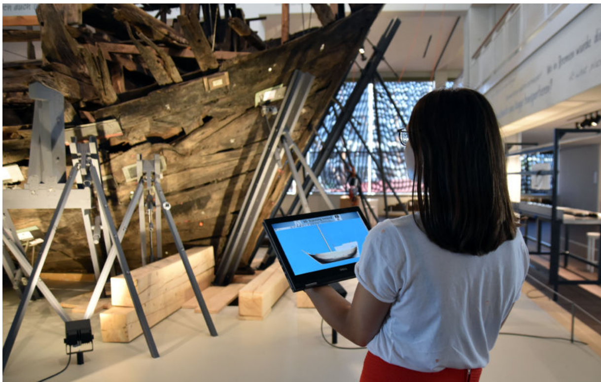
Deutsches Schifffahrtsmuseum (DSM) und Deutsches Auswandererhaus (DAH) forschen auch zur Zukunft der musealen Vermittlung. Das DAH ist mit einem Teilprojekt im Verbund "museum4punkt0" aktiv. Im DSM wurden bereits zahlreiche 360-Grad-Rundgänge und virtuelle Ausstellungen realisiert. Zentrales Element aller Bemühungen ist die Digitalisierung der Sammlung wie hier bei einem 3D-Modell der Hanse-Kogge im DSM.

Auch am Deutschen Auswandererhaus (DAH) gehen Forschung, Sammlung und Vermittlung Hand in Hand. So vielfältig wie die hier präsentierten Lebensgeschichten von Aus- und Einwander:innen ist auch das wissenschaftliche Team des DAH aufgestellt: Geschichte und Kulturgeschichte, Anthropologie und Ethnologie, Literatur- und Sprachwissenschaft sowie Philosophie sind vertreten. In ihrer Forschung stehen Migrationsursachen, Flucht und Vertreibung sowie Prozesse der Integration im Mittelpunkt. Kontinuierlich bauen sie die Sammlung von Fotos, Dokumenten aus und führen Interviews für das wachsende Oral History-Archiv des DAH. Es sind die Grundlagen sowohl für die Forschung als auch für die Ausstellung. Mit der 2021 eröffneten Academy of Com-