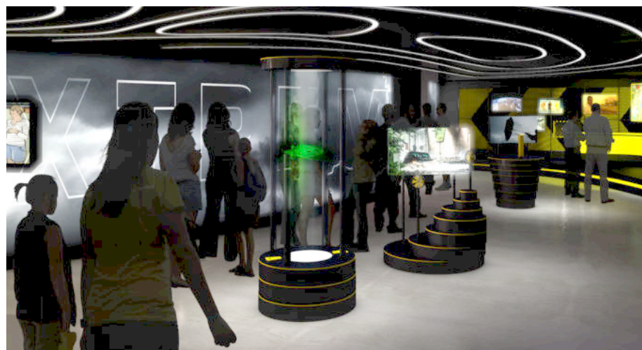
„Wetterextreme“ werden in einer neuen Ausstellung im Klimahaus Bremerhaven anschaulich gemacht. Dank Filmelementen und dreidimensionaler Inszenierungen werden Hitze, Regen und Sturm zumindest ansatzweise spürbar. In einem abschließenden sachlich-wissenschaftlichen Teil kommen auch die Betroffenen zu Wort. Illustration: Klimahaus / studio klv

www.dsm.museum www.dah-bremerhaven.de www.klimahaus-bremerhaven.de www.zoo-am-meer-bremerhaven.de www.bremerhaven.de/havenwelten