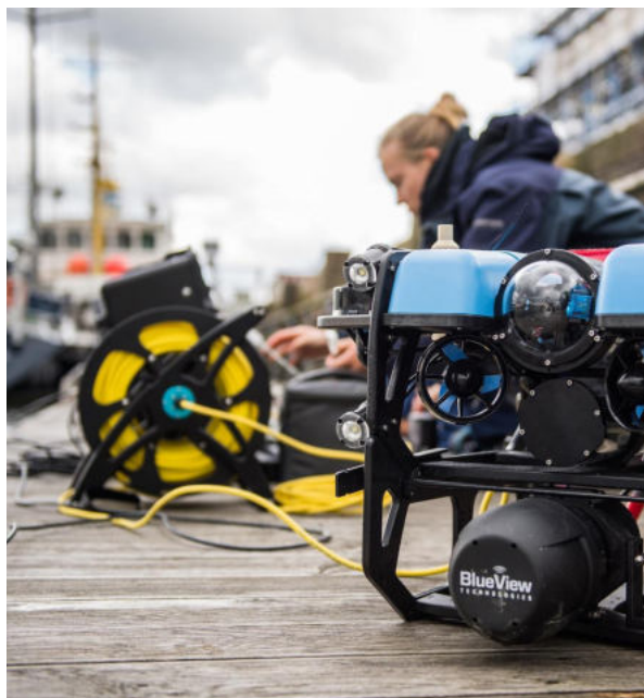
Das Zusammenspiel verschiedenster Sensorsysteme hat das DLR-Institut im Rahmen des Projekt MARLIN (Maritime Awareness Realtime Instrumentation Network) im Fischereihafen getestet. Eines der vielen Elemente, die zu einem Lagebild beitragen, ist ein ferngesteuertes Tauchfahrzeug mit hochauflösender Kamera