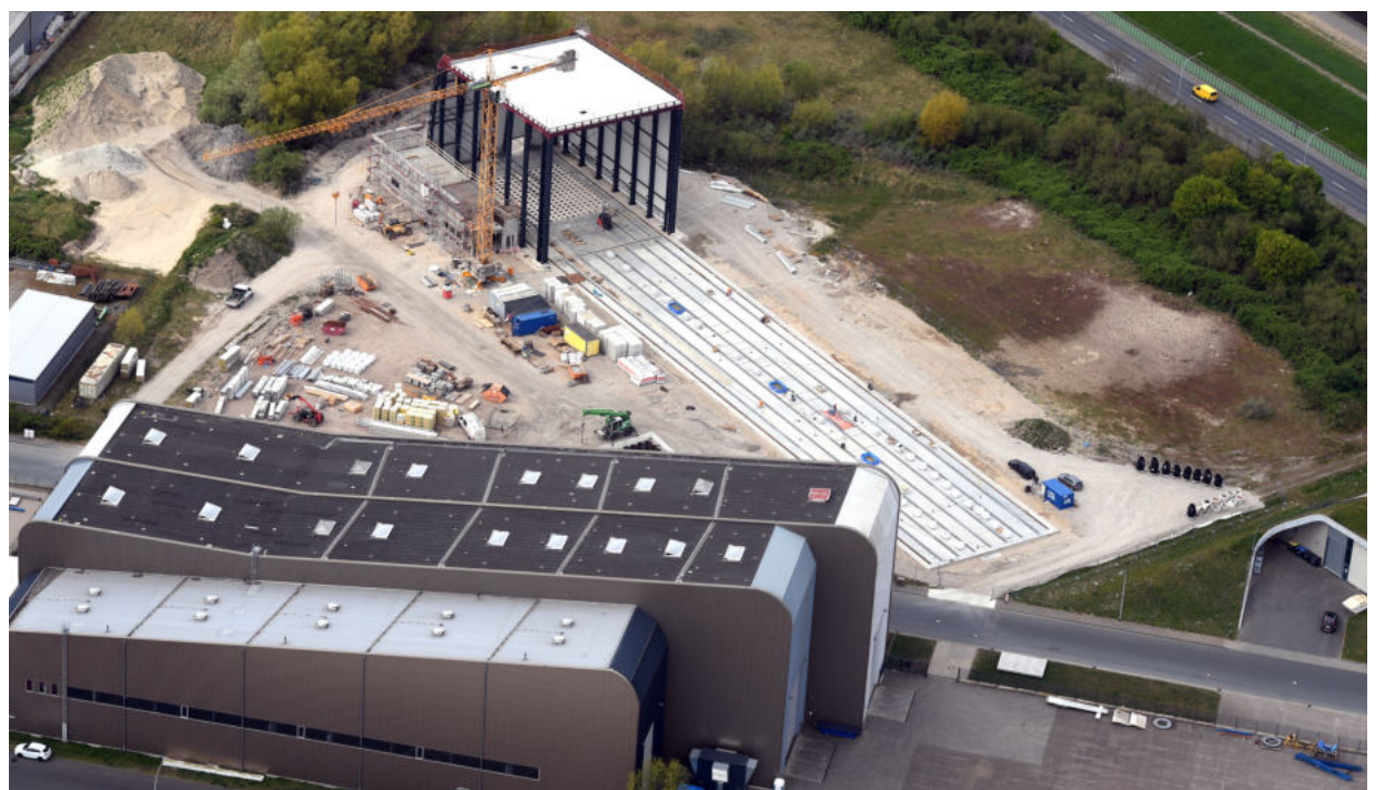
Eine einzigartige Prüf-Infrastruktur hat das Fraunhofer IWES in Bremerhaven aufgebaut. 2020 kam ein Prüfstand für XXL-Rotorblätter hinzu.