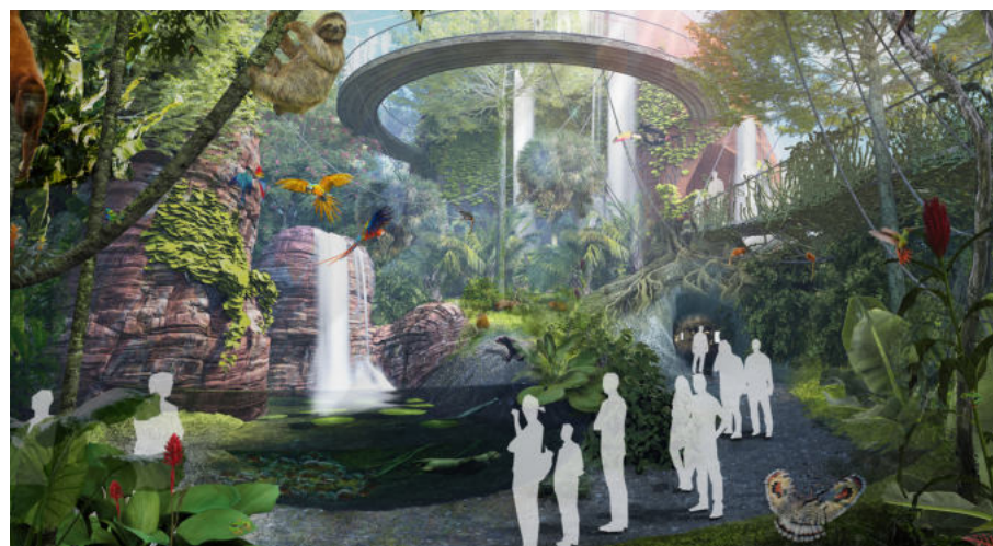
Sperrige Begrifflichkeiten wie genetische oder funktionelle Vielfalt und Vielfalt der Ökosysteme werden im geplanten Biodom Bremerhaven über die Faszination für Tiere vermittelt. Die Konzeptstudie für die Erweiterung des Zoo am Meer sieht unter anderem einen „Ausschnitt“ aus dem Amazonas-Regenwald vor. Illustration: dan pearlman