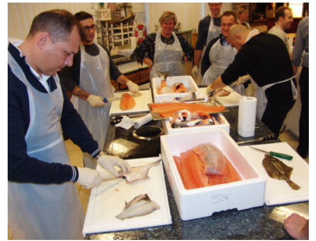
In der Küchenpraxis wird der korrekte Umgang mit den hochwertigen und oft auch entsprechend teuren Rohwaren vermittelt.

Ist der anspruchsvolle nebenberufliche Lehrgang geschafft, fungiert der Absolvent oder die Absolventin als Ansprechpartner:in und Person vom Fach zu allen Fragen aus Theorie und Praxis rund um das Thema Fisch und Seafood. „Kein Beruf, der mit Fisch zu tun hat – vom Fischer über den Koch bis zum Händler – bietet einen Gesamtüberblick“, be-