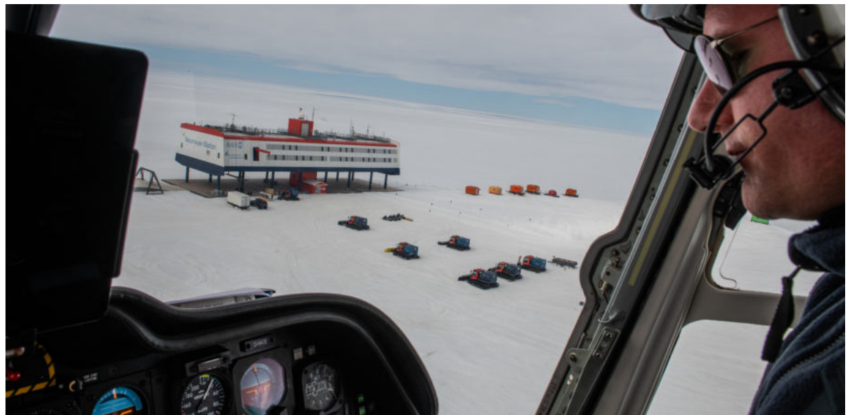
Im Anflug auf die Neumayer-Station III in der Antarktis. In dem komplexen Bauwerk steckt auch viel Expertise Bremerhavener Firmen.

Bau, Unterhalt und Logistik der komplexen Infrastruktur des AWI bedeuten auch Aufträge für die hiesige Wirtschaft, für Bauunternehmen, für Werften, für Zulieferer. So nutzt der Forschungseisbrecher „Polarstern“ Besuche im Heimathafen für die Wartung und Überholung auf der Lloydwerft. Und am Bau der Neumayer-Station III in der Antarktis arbeiteten die Bremerhavener Firma J.H.K. Engineering GmbH & Co. und die Bremer Firma KAEFER Construction GmbH.